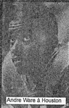
Andre Ware à Houston

A l'orée de sa 7e campagne, la NFL Europe vient d'avoir la preuve qu'elle pouvait plus que jamais compter sur la NFL. Celle-ci, en augmentant une nouvelle fois le nombre de ses joueurs envoyés de l'autre côté de l'Atlantique, confirme son attachement à la NFLE. Car c'est manifeste, de plus en plus d'anciens joueurs de NFLE commencent à percer en NFL. La NFLE représente donc un important vivier pour les 30 équipes NFL. Parmi les 152 joueurs envoyés (ils n'étaient que 36 en 1995), on trouve d'anciennes gloires universitaires, à commencer par les plus lointains comme Andre Ware, qui jouera cette